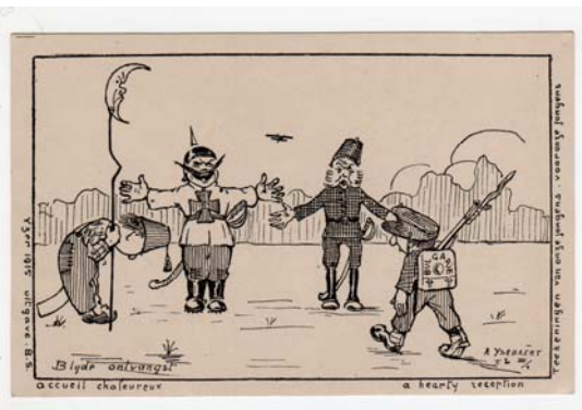
1.5 Blijde Ontvangst. A. Ysebaert