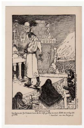
2.1 Wroeging. F. Claerhout