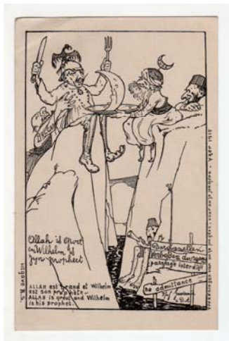
1.3 Allah is groot en Wilhelm is zijn profeet.