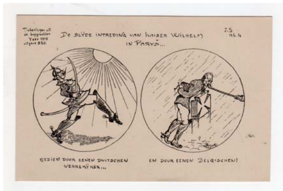
2.4 De Blijde intrede van Kaiser Wilhelm in Parijs.