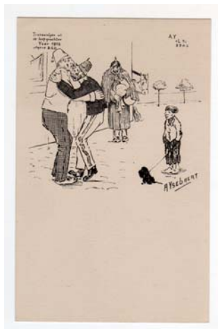
2.5 Het afscheid. A. Ysebaert